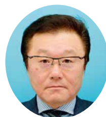
2Rリジョン・チェアパーソン 会員増強委員

理事長就任時は、コロナ感染が拡大期で有った。今年になってから、プーチンのウクライナ侵攻が始まり、天災と人災が重なり、大変な年度と成りました。国際法はウクライナを救えるのか！ ロシア軍の攻撃で破壊されてゆくウクライナの街並み。戦火から逃れて、国を出ていく人々、毎日報道されるウクライナの様子を見て、心を痛めております。この時代には考えられない事であり、世界の常識も破壊されて、残念であります。国連では色々会議を開き世界に訴えて居ますが、戦火はいっこうに収まる様子は無く、むしろ一般人を巻き込んで被害が拡大しています。国際法はこの戦争を終結出来るのか?とても心配しております。世界平和を目指し決めたルールが、有事に使えないので有れば、意味が無いです!想定が甘いのか?意図的なのか? 私達ライオンズクラブには、道徳綱領[平和と自由を守り、社会奉仕に精進する]と有ります。既に人道的支援を中心に、ウクライナのライオンズクラブと連携して、支援活動に取り組んでおります。終結交渉が進まず、はがゆいですが、ウクライナの一日も早い平和解決を祈ります。この状況下での活動は、大変な一年でした。皆さんに感謝申し上げます。