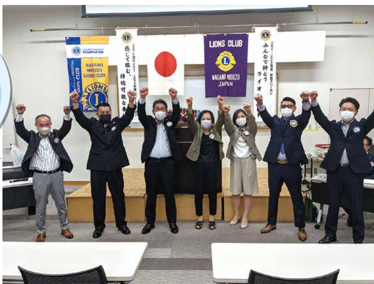
6月10日 6月第1例会次期準備委員会 8役御礼のあいさつの後、揃ってライオンズプアー