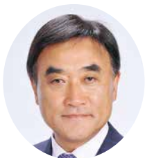
(一社)日本ライオンズ理事長 334複合地区前ガバナー協議会議長 地区名誉顧問・元地区ガバナー 地区ガバナー名誉委員