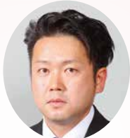
L. 鹿熊 崇 テール・ツイスター