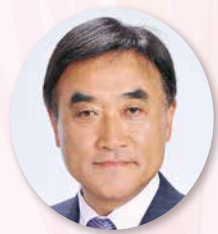
334複合地区ガバナー協議会議長 334-E地区名誉顧問会議長・前地区ガバナー 地区ガバナー名誉顧問