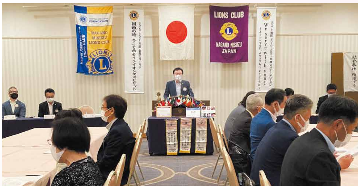
6月18日最終例会 金澤会長挨拶