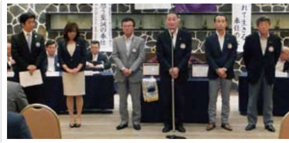
遠藤丸の寄港(1年間大変お疲れ様でした。)と新役員・伊倉丸の船出(1年間よろしくお願い致します。)