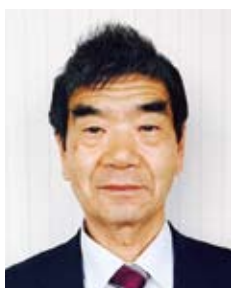
地区PRライオンズ情報委員長