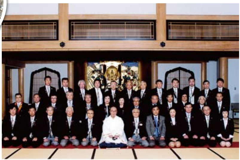
長野みすずライオンズクラブ結成35周年記念