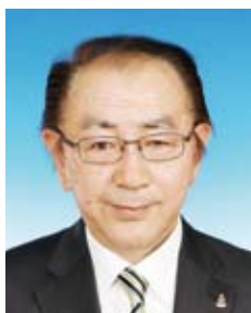
地区長野県連携協定推進室長

今期はITと会報とPRが協調協同態勢で、より密な連携プレイで情報発信し、特に、奉仕活動の取材などを通じて会員ライオンの皆様の笑顔とすばらしい活躍を広く周知していきたいと存じます。皆様からの沢山の情報もお待ちしております。