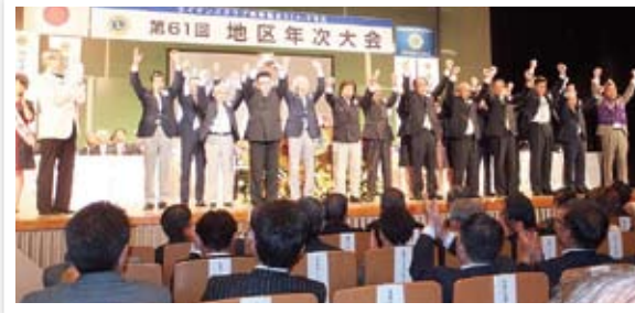
「100%MJF クラブ」 LICF 感謝状贈呈 (メンバー全員が登場して表彰を受けました。)