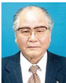
地区名誉顧問・元地区ガバナー