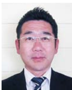
キャビネット副幹事 (地区計画委員長)

産声をあげたばかりの暗中模索の組織であります。地区役員のみならず当クラブ員の皆さまにおかれましても格別なるご理解のほどを切にお願い申し上げます、就任のごあいさつといたします。