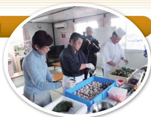
遠藤しがつくった 笹ずし、おもち、とん汁のふるまい