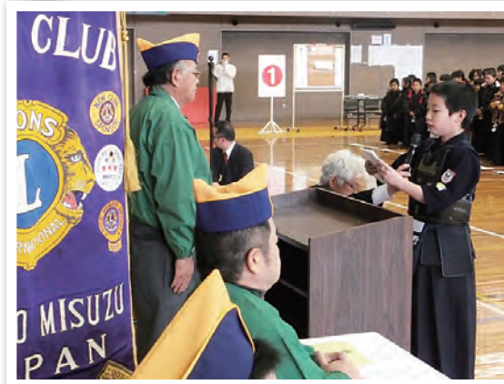
少年剣士の選手宣誓