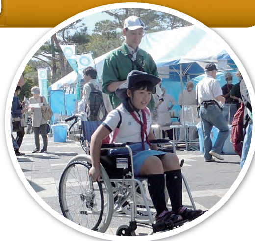
今回は車イスと白杖の体験コーナーをつくりました