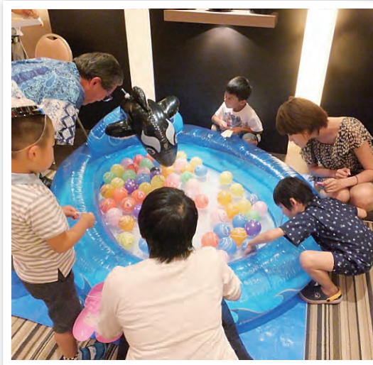
夏祭り風の催しにレオたちは大喜び