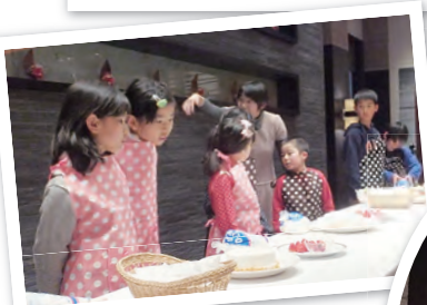
レオたちのケーキづくり体験