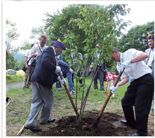
2R・3Z「山の日」イベントとして オヤマザクラを贈呈