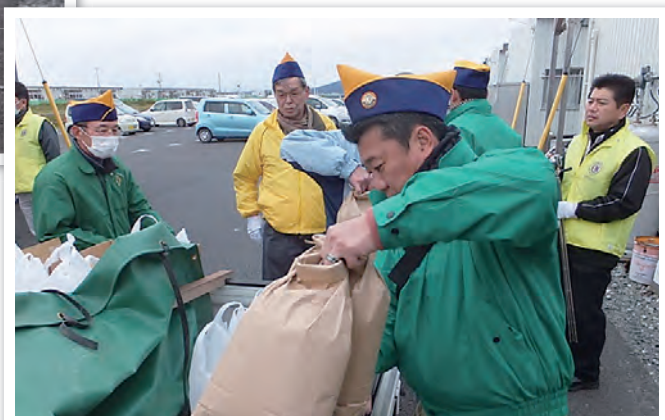
仮設住宅の住民のみなさんへ米と野菜を配達