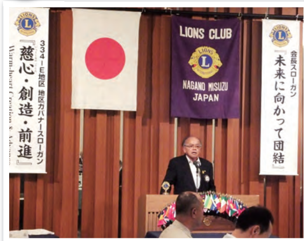
河田執行部のスタート