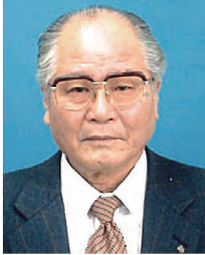
地区名誉顧問・元地区ガバナー