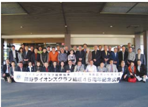
長野みすずLCより30人のライオン、LLが参加