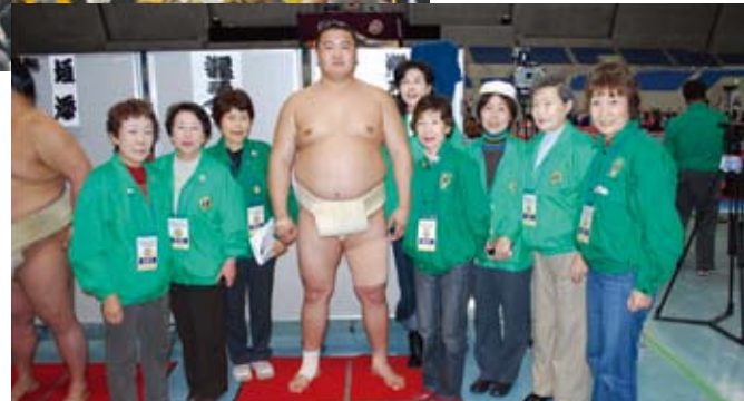
円福寺愛育園の子供たち