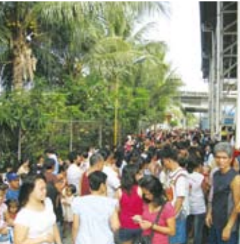
医療奉仕を求め集まる現地の人