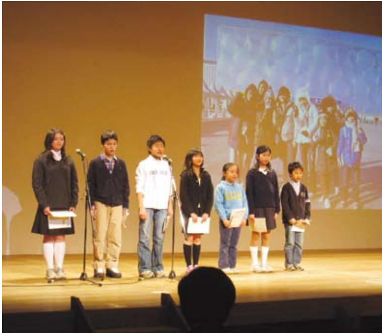
長野冬季五輪を機に始まった一校一国交流活動も今回で10回目。 長野の小中高校六校の児童や生徒たちによる発表会の風景。