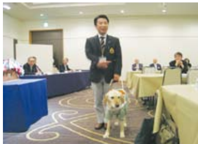
日本盲導犬協会よりの講義