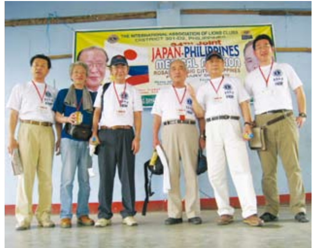
2日間の医療奉仕活動を終えて