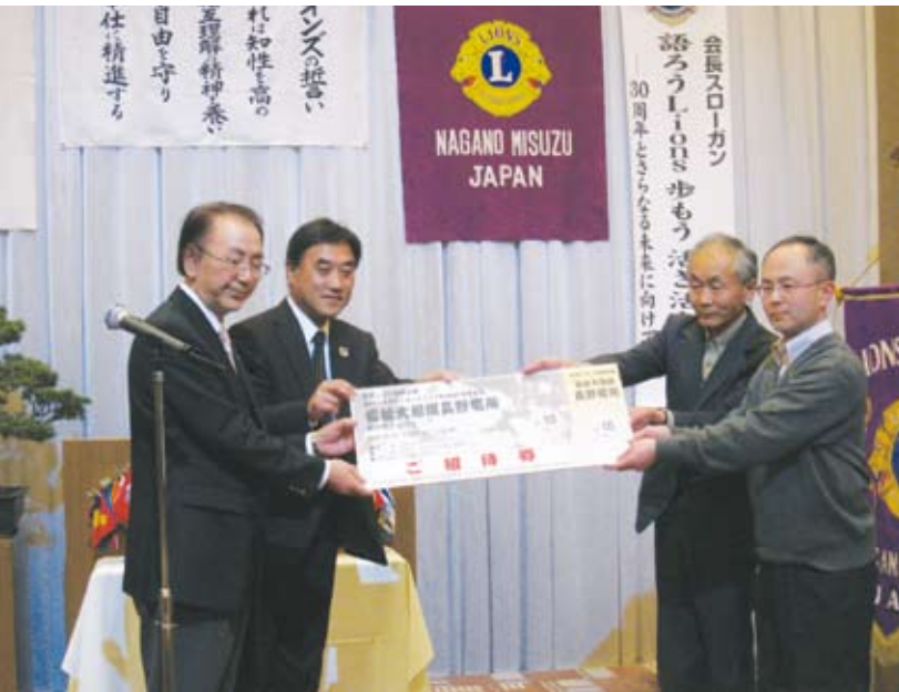
3/12 招待福祉施設への入場券贈呈式